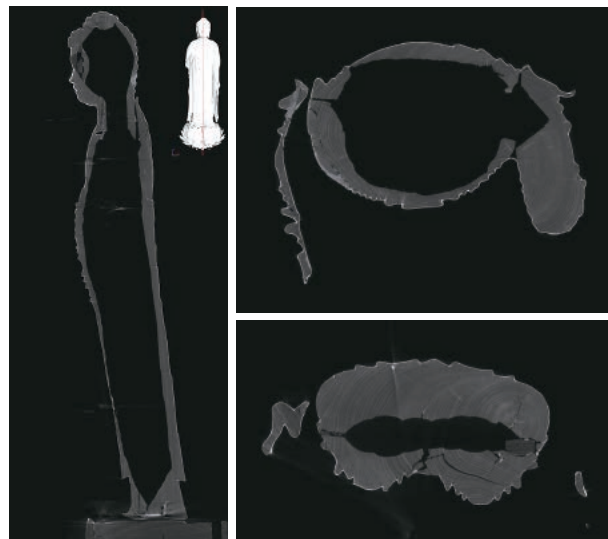
画像2 木彫像のCT断面画像例

仏像などの木造彫刻のCTの場合では、表面付近の虫害や、木材の割れが内部のどこまで及んでいるのかなど損傷の程度を確認することができ、さらには、その像が一つの木から彫られているか、いくつかの部材を繋ぎ合わせて彫られているかなど、部材の状態から制作方法、組み立ての順序なども推定することが可能です。損傷がひどく修理の際に解体が必要になると、こうした情報から解体の際にできるだけ作品を傷つけないように処置する方法や具体的な修理作業の検討を行うことができます。